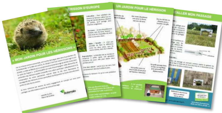
Un livret de présentation avec mot de la collectivité