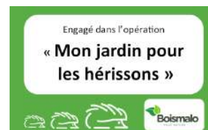
L'autocollant du programme