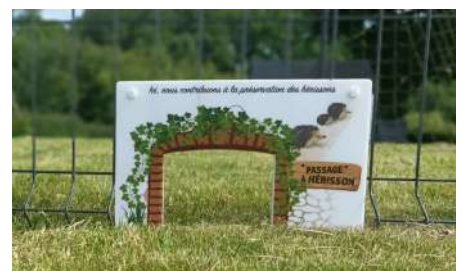
Passages 1 et 2 en recto verso